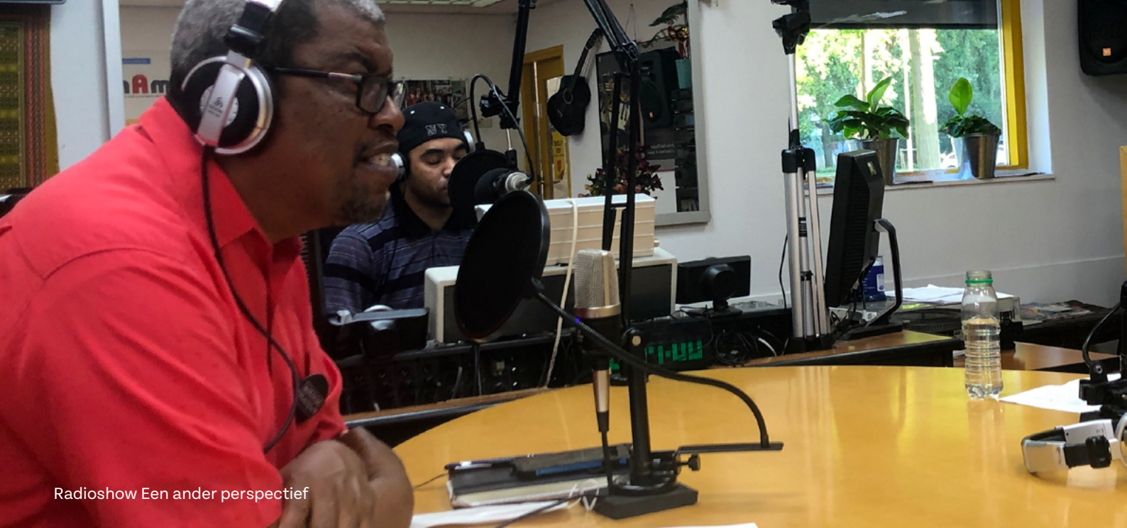
Radioshow Een ander perspectief