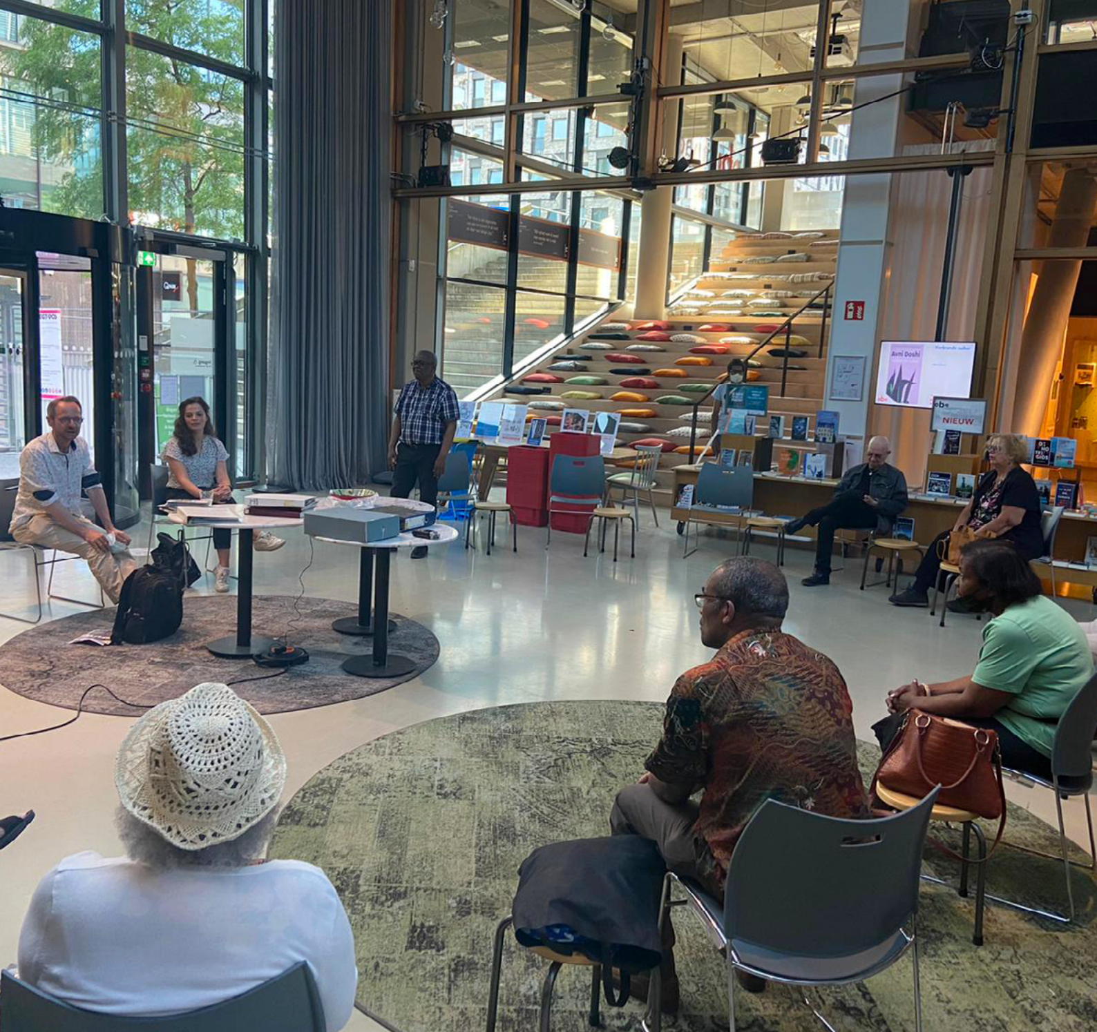
Verzamelbijeenkomst Rouw, Herdenken & Bijlmer vliegkamp in samenwerking met Museum van Doorn