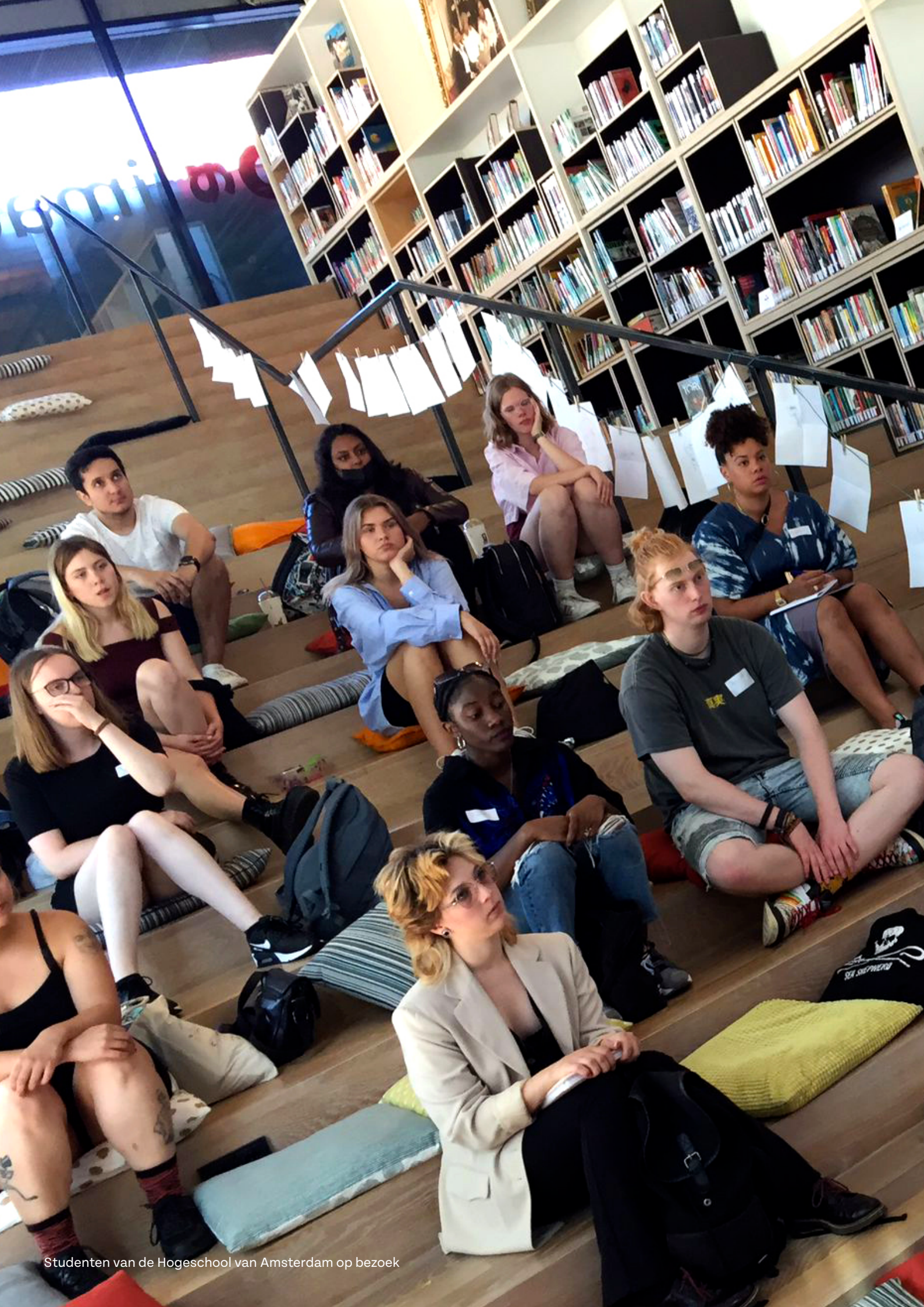
Studenten van de Hogeschool van Amsterdam op bezoek