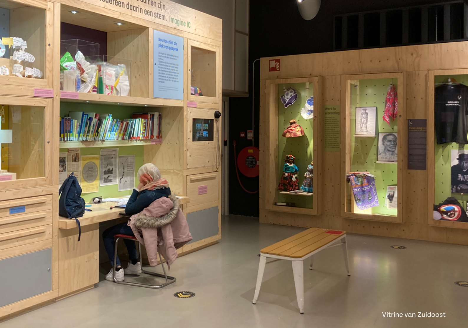
Vitrine van Zuidoost

Het project Erfgoedwijzer is bedoeld om leerkrachten én erfgoedinstellingen kennis, handvatten en werkvormen te geven om leerlingen een erfgoedwijze blik te laten ontwikkelen. Zo leren zij genuanceerder te kijken door zicht te hebben op verschillende perspectieven. Erfgoedwijsheid sluit daarom ook goed aan bij persoonsvorming en burgerschap. Erfgoedwijzer wordt gefinancierd door het Fonds voor Cultuurparticipatie. Het project is gebaseerd op het onderzoek van het lectoraat Cultureel erfgoed van de Reinwardt Academie en Imagine IC die de methode Emotienetwerken ontwikkelden. Betrokken partijen zijn o.a. Erfgoed Gelderland (penvoerder) en Erfgoedhuis Zuid Holland, Nationaal Militair Museum en Het Utrechts Archief. Het Fonds voor Cultuurparticipatie zorgt voor financiële ondersteuning. Het project loopt tot mei 2023.