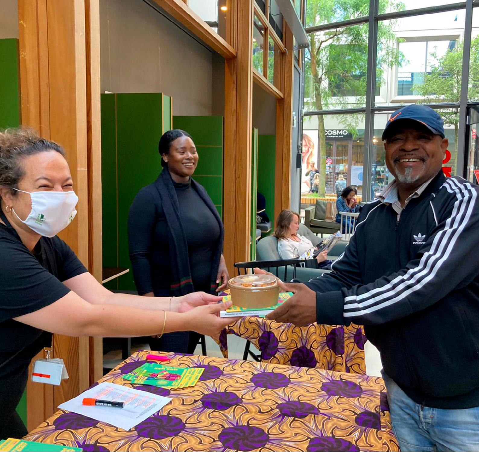
Heri heri uitdelen voor Free Heri Heri tijdens Keti Koti