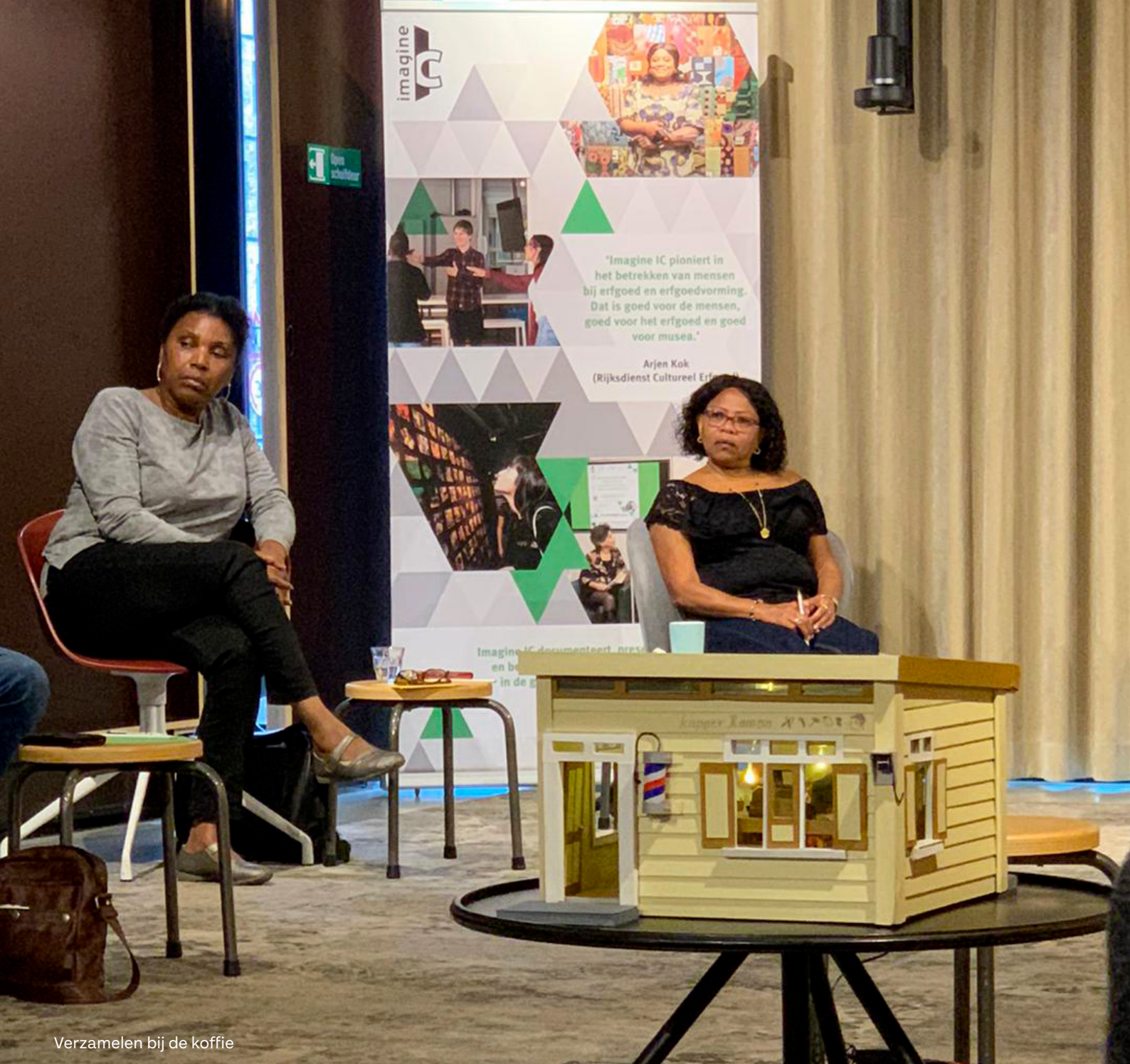
Verzamelen bij de koffie