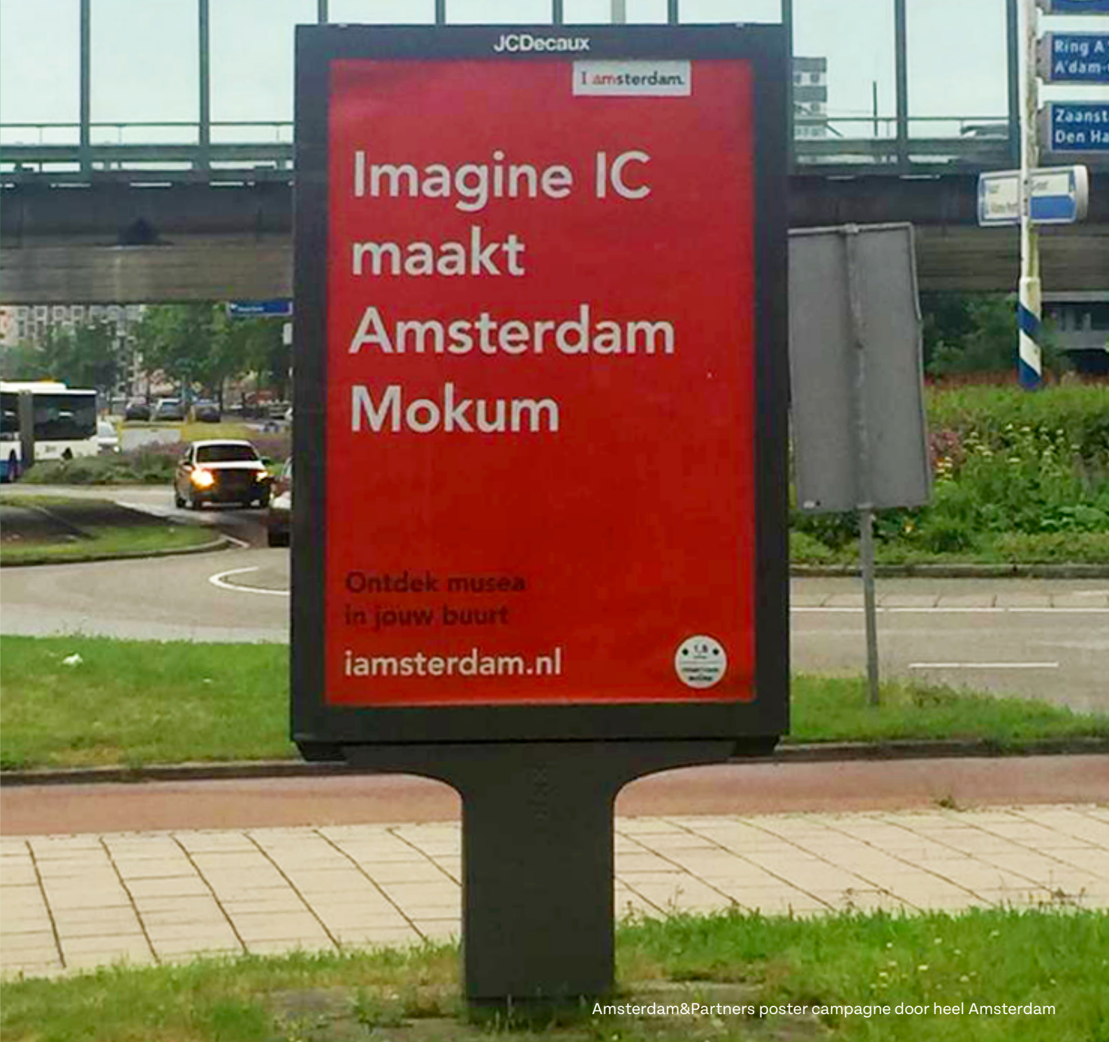
Amsterdam&Partners poster campagne door heel Amsterdam

Verder hebben we dit jaar ook weer ingezet op een mix van het maken van extra online content voor de website en Instagram om zo meer te kunnen delen met het bredere publiek. Onze Instagram groeide hierdoor gestaag verder naar 982 volgers (december 2021: 750). Daarnaast bleven we communiceren op Twitter, Facebook en LinkedIn. In het najaar verzorgden we een gespreksstof in eigen huis, die we voor het eerst ook als livestream via YouTube aanboden.