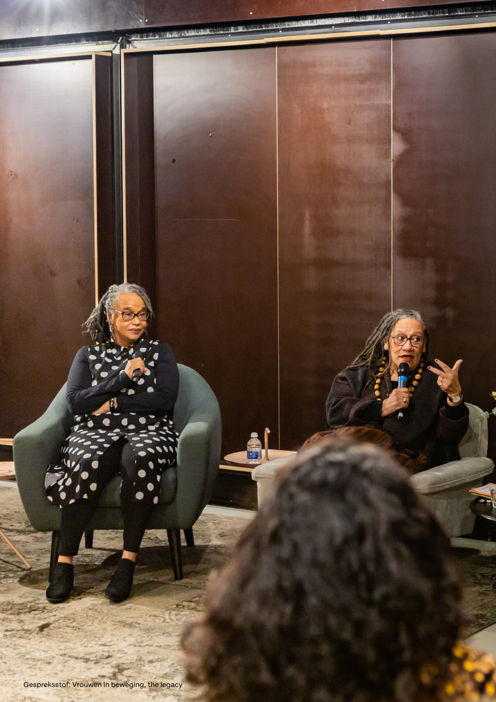
Gespreksstof: Vrouwen in beweging, the legacy